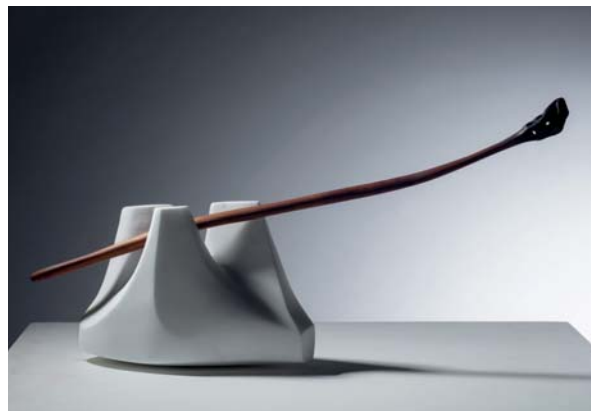
Through dimensions 70 x 15 x 20cm