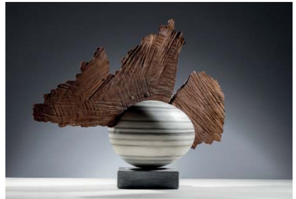
The Sparkle of Time dimensions 52 x 15,5 x 38cm