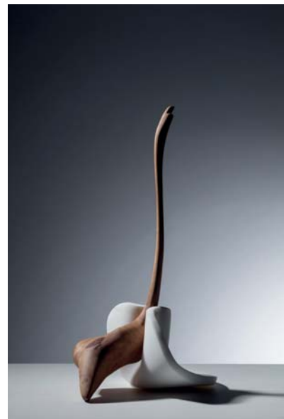
Reinforcement dimensions 30 x 28 x 52cm