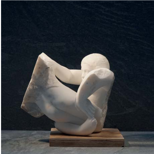
Supporto dimensions 32 x 24,5 x 29cm