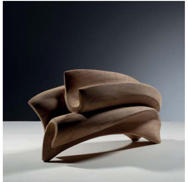
Star Trail dimensions 32 x 14 x 15cm

Le meteore lasciano scie luminose quando viaggiano nell'universo e poi scompaiono. A Oriente come a Occidente, ci sono associazioni poetiche con le meteore e le persone esprimono desideri sperando di vedere stelle cadenti. Spero di cogliere il momento in cui si vedono le meteore.