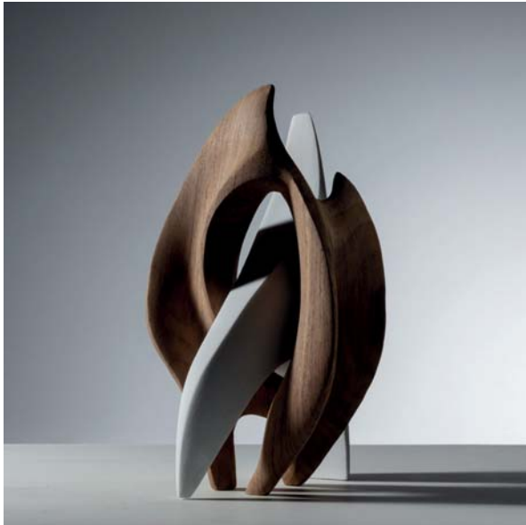
Una danza per la luna dimensions 23 x 20 x 33cm