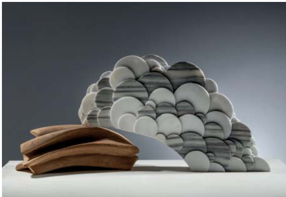
Dolce contatto dal cielo dimensions 66 x 17 x 29cm

Le linee contorte di questa scultura, che mostrano il movimento della Luna e l'ombra della Luna sono collegate insieme come se stessero danzando. Guardando questa scultura, amici di diversi paesi possono immaginare di ballare tra di loro.