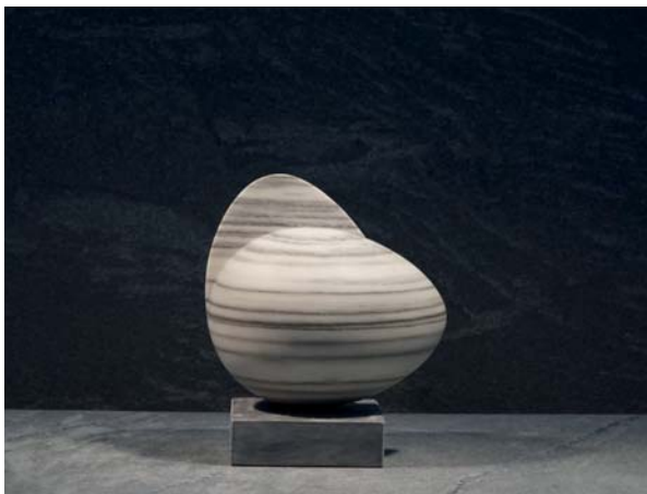
Tempo dimensions 19 x 14 x 24cm

Questo albero bianco, aggrappato a una mezzaluna, richiama la forza degli elementi tra la terra e l'universo. In mezzo, l'uomo, seduto come su un trono. Elevazione simbolica della crescita, ripresentazione della luce e della vita.