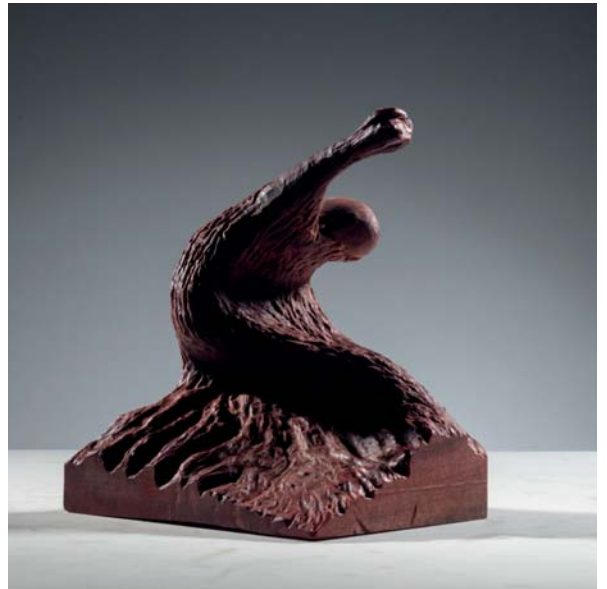
Inertia Prison dimensions 18 x 17 x 21cm

Le azioni umane assecondano il nostro pensiero, le nostre culture, il nostro ambiente, le nostre emozioni, ecc. E non possiamo resistere, come essere catturati dalla legge dell'inertia.