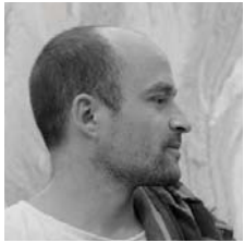
奧利朗·布辛 Aurélien BOUSSIN

范察絲嘉·貝納丹尼 生於意大利卡拉拉，最初入讀當地的藝術學校，後以榮譽成績畢業於卡拉拉藝術學院，主修雕塑。在學期間，貝納丹尼到SGF雕塑與設計室實習，學會了傳統的大理石雕刻技巧，獲益良多。她全心投入藝術研究，對她來說，以雕塑作為表達的方式，就如水對生命一樣重要。貝納丹尼於2004年在卡拉拉舉行首個個展，至今已參與了多次國際藝術展和藝術活動，且贏過多個國際獎項與表揚，包括：聯合國教科文組織獎（2005年）；卡拉拉市政府頒授優異獎（2008年）；並在2007年應邀擔任於澳洲悉尼舉行、由意大利領事館主辦的「海邊雕塑」展的留駐藝術家。近年她頻頻參與世界各地的雕塑研討大會，到過伊朗、中國、德國、烏克蘭、智利等國。現時她仍在卡拉拉生活和工作。