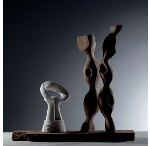
Moon and Life dimensions 52 x 14 x 49cm