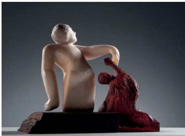
Il dono dimensions 36 x 17 x 29cm

Come nella prima fase di Fusion, ho scelto la Fenice (che qui è piccola e appena nata), per rappresentare la forza della rinascita, un nuovo equilibrio, una nuova vita.