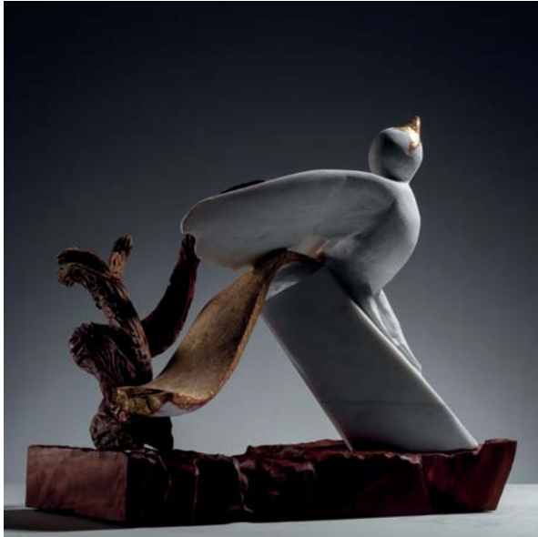
Fenice dimensions 36 x 34 x 34cm