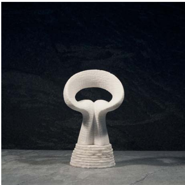
Albero mezzaluna dimensions 13,5 x 10 x 21,5cm