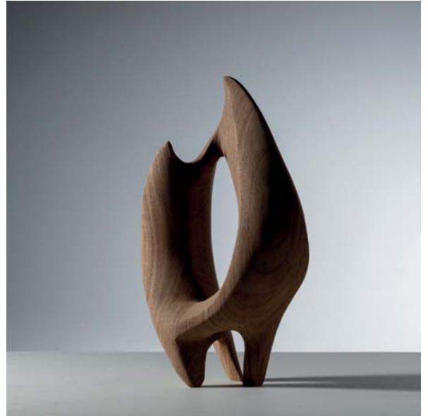
Dancing Moon dimensions 19 x 10 x 33cm

Meteors leave bright trails when they travel across the Universe, and then disappear. In Eastern and Western cultures, there are also poetic associations with meteors, and people will make wishes for them. I hope to capture the moment when people see the meteors.