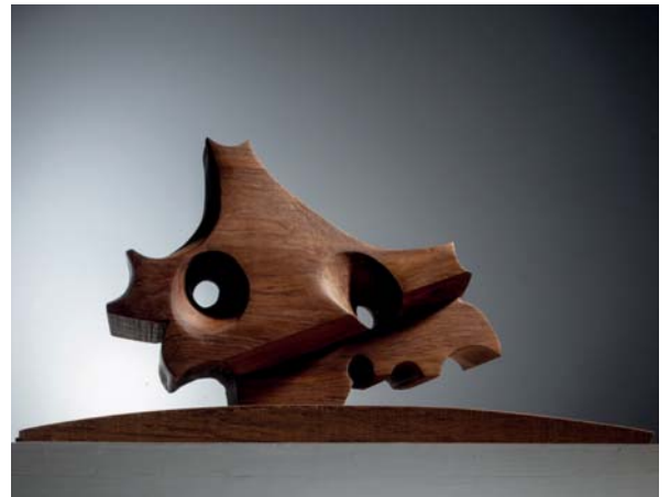
Stonescape 1 dimensions 45 x 30 x 23cm

L'opera si basa sulla pietra cinese Taihu come concetto creativo, e i suoi fori circolari sono come una cornice per catturare lo scenario delle quattro stagioni. Questo pezzo di pietra Taihu è posto su una piattaforma curva, che implica la bellezza della Terra.