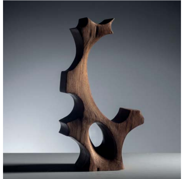
Stonescape 2 dimensions 10 x 17 x 32cm

The work is based on the Chinese Taihu stone as a creative concept, and its circular holes are like a frame to capture the scenery of the four seasons. This piece of Taihu stone is placed on a curved platform, implying the beauty of the Earth.