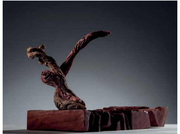
Mono No Aware dimensions 36 x 34 x 29cm

Human actions accord to our thinking, our cultures, our environments, our emotions, etc. And we can't resist it, just like being caught by the law of inertia.