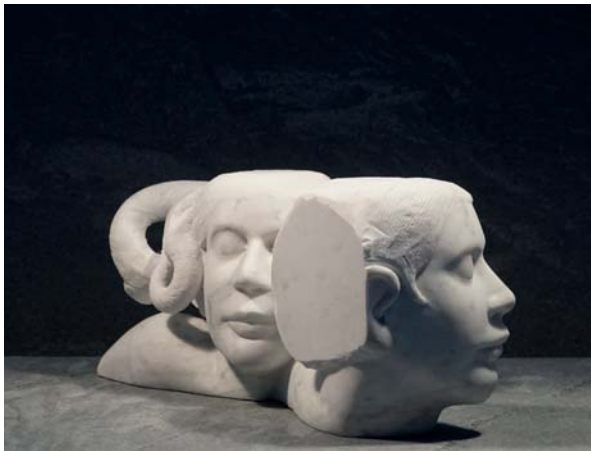
Intuizione dimensions 43 x 13,5 x 19cm

Attraverso un equilibrio tra la fisicità della scultura e il suo movimento, ho voluto raccontare che il sostenere l'altro e sé stessi è un lavoro costante sul proprio personale equilibrio.